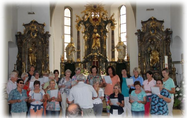
In der katholischen Kirche in Gundelsheim