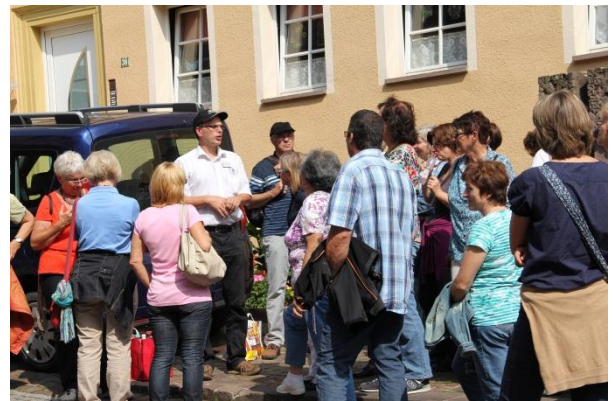
Interessant, was man so alles über Gundelsheim erfahren kann.