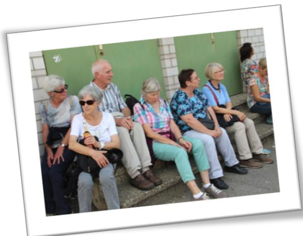
...und wieder ist „Warten auf den Zug“ angesagt.