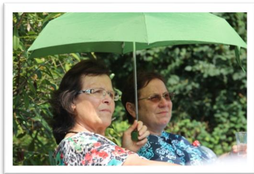
Unter einem Regenschirm in der Sonne